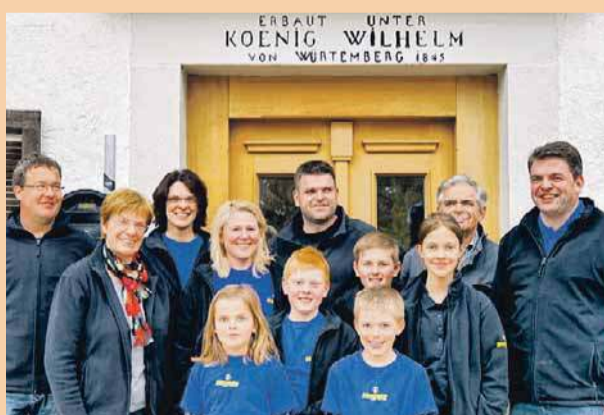
Familie Heydt freut sich am kommenden Wochenende auf viele Besucher.

Heute liegen die Schwerpunkte des Unternehmens nicht mehr in der landwirtschaftlichen Dienstleistung sondern im Fuhr- und Baggerbetrieb, der Dienstleistungen für Erd-, Tief- und Straßenbau sowie Abbruch und Transporte anbietet. Eine Besonderheit sind die speziellen Bauleistungen für die Landwirtschaft, wel-