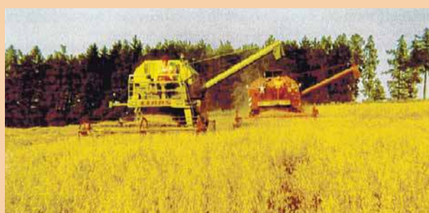
Alles begann 1964 mit der Landwirtschaft.

Am kommenden Wochenende sind alle eingeladen, das 50-jährige Jubiläum mit einer Jubiläumsparty am Samstag und einem Tag der offenen Tür am Sonntag mitzufeiern!