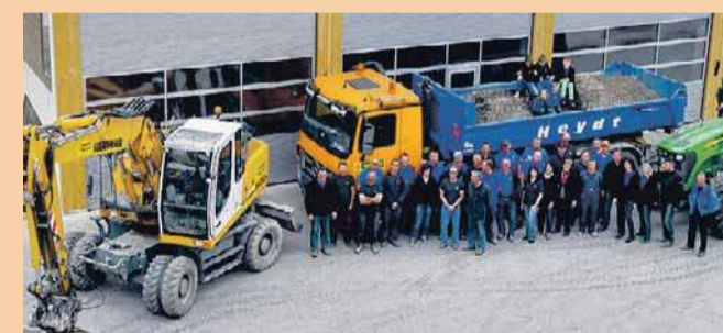
Der Heydt-Stammsitz vor den Toren Aulendorfs